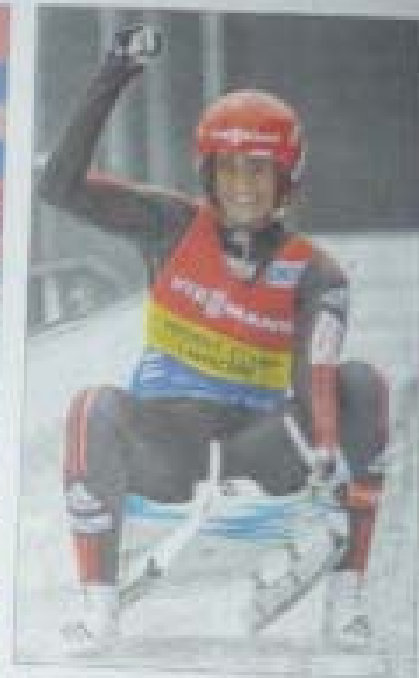
Natalie Geisenberger freut sich.