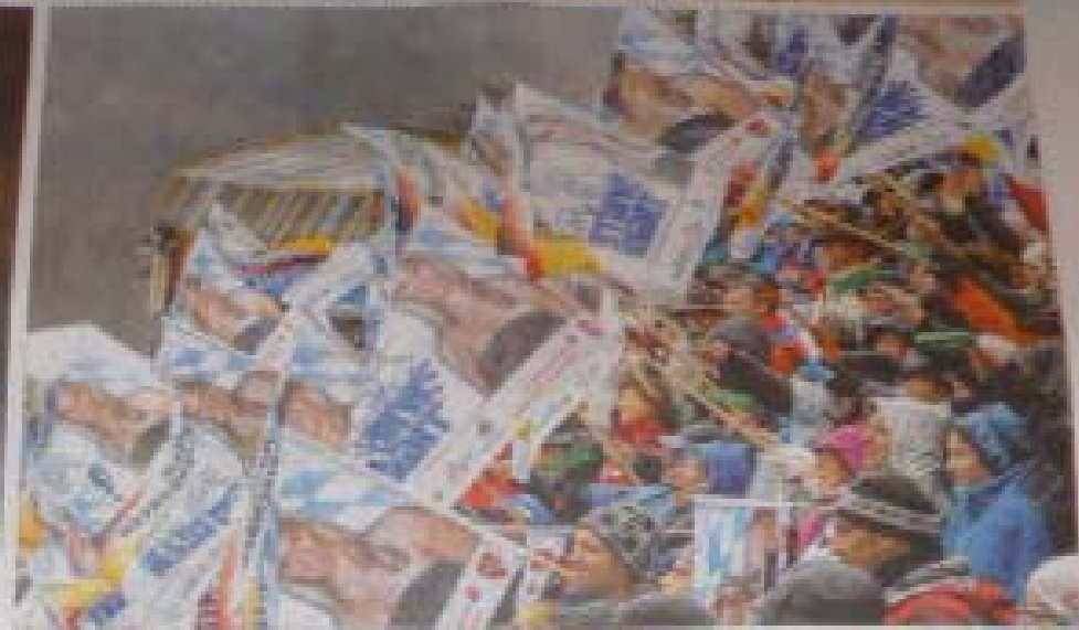
Ein Moment der Begeisterung bei der Heimreise von Waidring