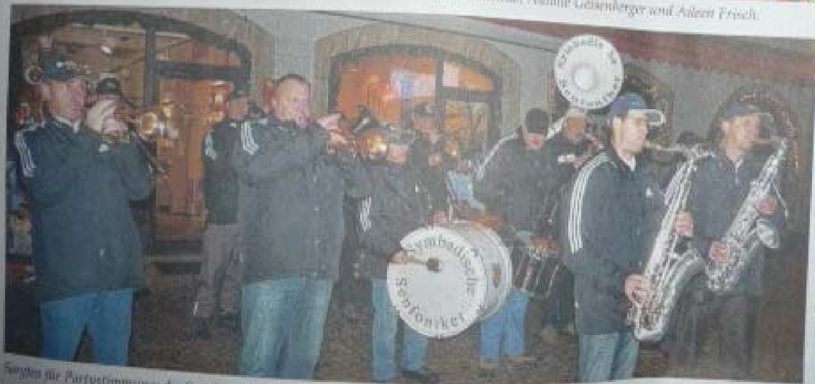
Sorgen für Partystimmung: die Symbadischen Senfweiler.